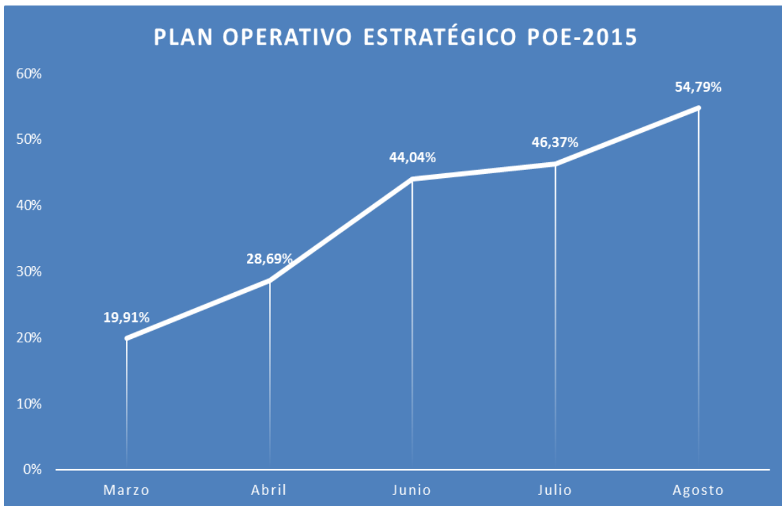
Gráfica 1. Logro acumulado